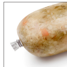
Cua de l'embotit completament exempta de producte.