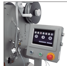
Accessori de clip en carret per altes produccions.