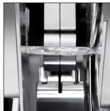
Màquina amb separadors que permet produir amb la cua neta.