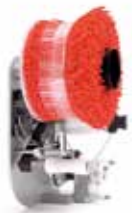
Sistema de llaços