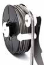
Clips en carret