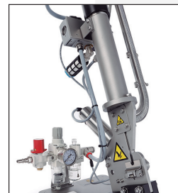
Fàcil i ràpida extracció del producte un cop tancat el clip