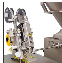
Treballa connectada a embotidora continua de pistó.