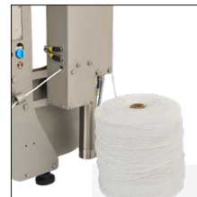
Alimentador de cordill sarta per produir embotits en format ferradura.